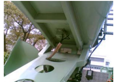
NHG 900 L